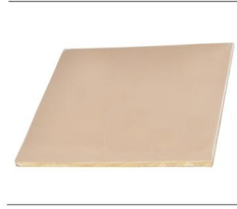
TECSOUND BARİYER TECSOUND BARRIER